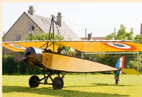
De replica die zal te zien zijn op de tentoonstelling.

Toen de eerste oorlogswinter voorbij was, kwamen steeds meer vliegtuigen de frontlijn overvliegen. Verkenningsvluchten en bombardementsvluchten werden bij goed weer dagelijks uitgevoerd. Alhoewel de frontlijn op 30 km westwaarts van Hulste lag, vlogen geregeld 'vliegers' over het dorp. Een attractie voor de jongeren maar een beduchtheid voor de Hulstenaars die wisten dat een overvliegende machine veelal een lading bommen bij had.