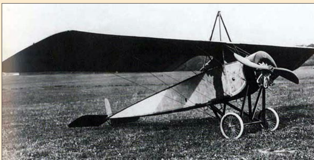
Historische foto van dergelijk toestel

Pieter Kerckhof (°1926 - † 2002) noteerde deze getuigenis van Cyriel Debackere. Cyriel was 14 jaar ten tijde van de noodlanding: