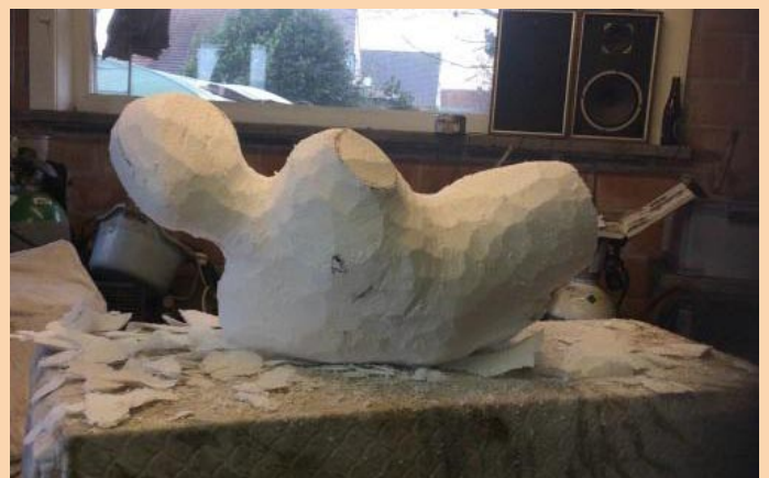
Een greep uit de making-of en op de achtergrond een tipje van de sluiert